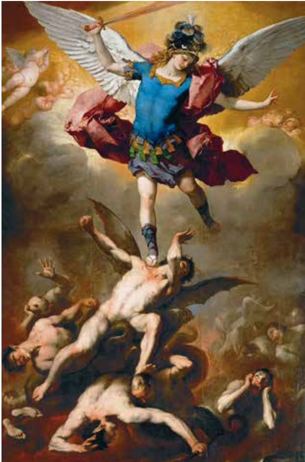
De kosmische strijd

soms zelfs stilistische kenmerken uit het Nazisme. De precieze aantallen zijn moeilijk te schatten, maar van de 1100 miljoen hindoes in de wereld gaan honderden miljoenen mee in deze beweging en gelukkig ook honderden miljoenen niet.